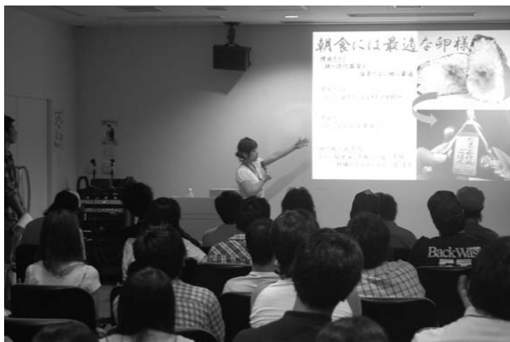
図2 ペチャくちや Kaetsu