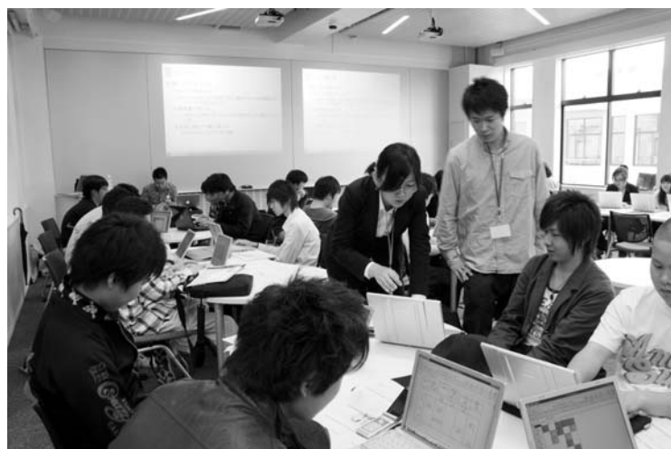
図 1 KALC 教室での講義

このため、嘉悦大学では固定的な＜コンピュータ教室＞を廃止した。大学特有の環境・設定をなるべく排除し、自分自身のノート PC と大学環境に特化しない一般的なネット・クラウド環境を活用する形での実践的な演習を行うようにした。ノート PC の利用インフラとしては、全学的に整備された無線 LAN 環境を活用する。メール (Gmail) など多目的に Google Apps for Education を活用し、クラウドコンピューティングを大きく取り入れている。この環境を活用し、携帯電話との有機的な連携を行う試みも行っている。